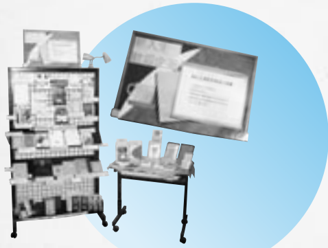
図書館 1 階エレベータ 横でミニ展示しました