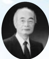
学 長 馬 場 忠 雄