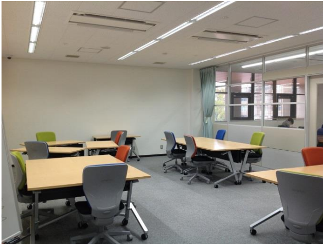
↑この写真は滋賀医大写真部の方に撮影していただきました。

昨年度の改修工事を終え、きれいで便利になった図書館の施設をご紹介します新シリーズです。 まず最初は「アクティブ・ラーニング室」！