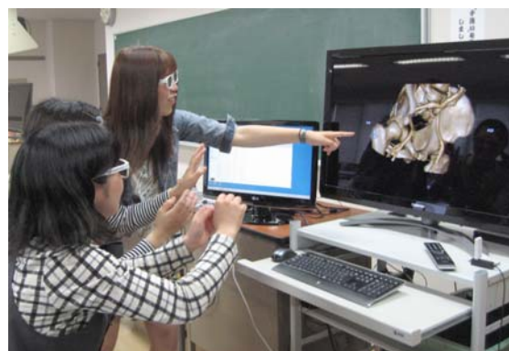
図2 3D眼鏡をかけて3D教材を観察している様子。インタビューした学生とは異なる。

倫理的配慮については、研究協力への依頼に際し、匿名性の確保、データの厳重管理など個人情報を保護すること、研究不参加や途中辞退の場合でも不利益は被らず、成績にも影響しないこと、研究結果は論文として公表することを口頭と書面で説明し、研究参加者から同意書への署名によって承諾を得た。