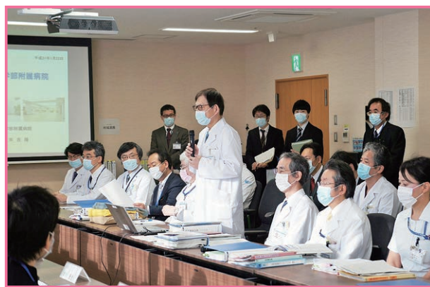
訪問審査に臨む当院スタッフ

※病院機能評価とは…我が国の医療機関の機能の充実・向上を図るために、公益財団法人日本医療機能評価機構が第三者機関として中立的な立場で医療機関の機能を評価するもので、令和元年7月12日現在で発表されている認定病院数は、全国8,389病院中2,178病院となっています。