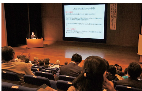
県民公開講座のようす（滋賀アレルギーフォーラム）