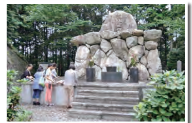
滋賀医科大学霊安墓地