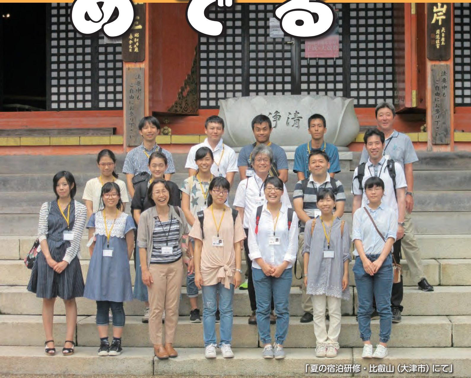
「夏の宿泊研修・比叡山（大津市）にて」