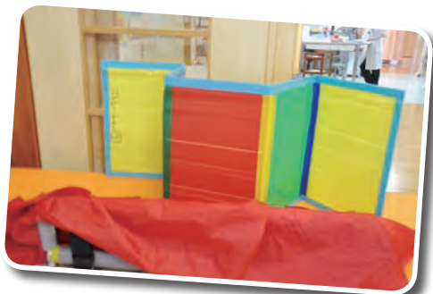
◀びわこ学園 職員さんが手作りされた 介護のための補助器具

今回の研修でお世話になったすべての方に感謝の気持ちでいっぱいです。次回からもぜひ参加させていただきたいです。