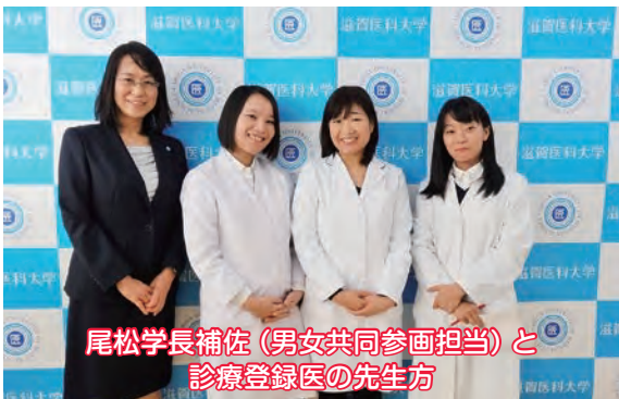
尾松学長補佐(男女共同参画担当)と診療登録医の先生方

早速、夕方のニュース等に取り上げていただき、本プログラムについて周知する機会となりました。