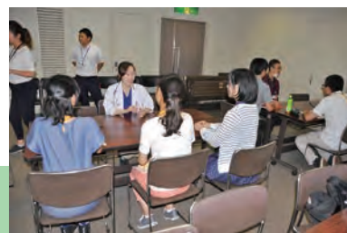
大津赤十字病院で働く先輩を囲んでの座談会の様子