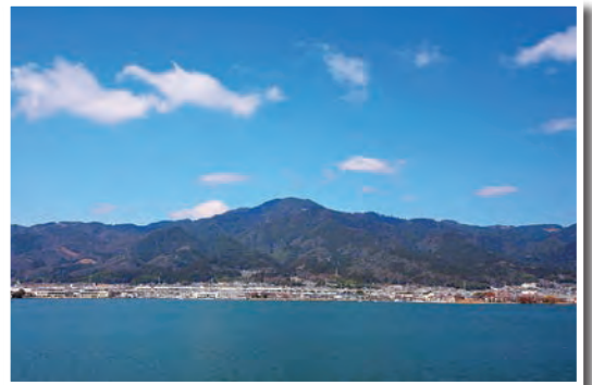
琵琶湖から見る比叡山