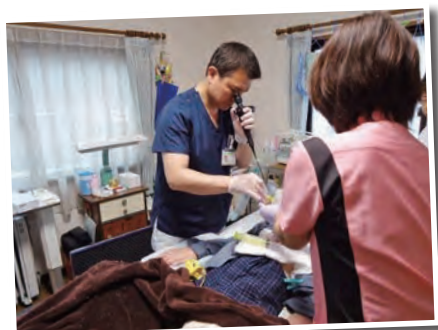
▲在宅で神経難病（ALS）患者の胃瘻から内視鏡検査をしているところ