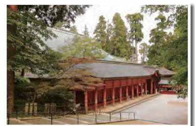
延暦寺・根本中堂