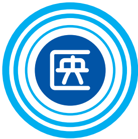
滋賀医科大学 学章

滋賀医科大学の学章は、昭和56年4月に京都市立芸術大学の舞原先生が作成されました。デザインの意味は、「さざ波の滋賀」と「一隅を照らす」を組み合わせたものです。