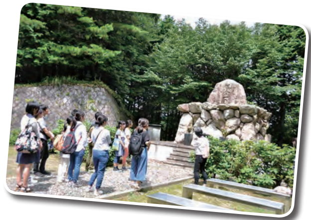
▲比叡山滋賀医科大学霊安墓地にて

今回の研修を通して、私はこの地、人に支えられて医師になるのだと改めて感じました。次回以降の研修にもぜひ参加させて頂き、滋賀県の魅力を知って滋賀県をもっと好きになっていきたいです。