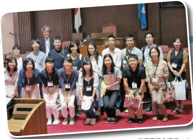
▲滋賀県議会議場にて