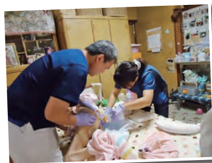
▲在宅で褥瘡処置を行っているところ

20年前に、今の職場で仕事をしているとは予想もしませんでした。これからの10年後の自分の状況も全くわかりません。その時その時で生きていけば、また何か道が開けていくのではないのでしょうか。迷ったり、引き返したり、それも人生だと考えています。まずは、先に進んでみることです。いいじゃないですか、まっすぐ行かなくても。