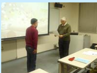
代表の方に修了証書をお渡ししている様子

11月2日(金)、8日(木)、16日(金)の3日間、ピアザ淡海において第29回目となる滋賀医科大学公開講座を実施しました。