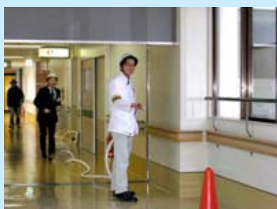
屋内消火栓操作訓練