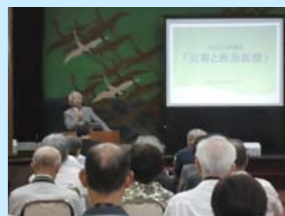
柏木病院長の挨拶