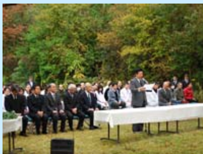
センター長慰霊のことば

その後、出席者全員による献花が行われ、過去一年間(平成23年10月～平成24年9月)に実験に供された動物の御霊の冥福を祈りました。