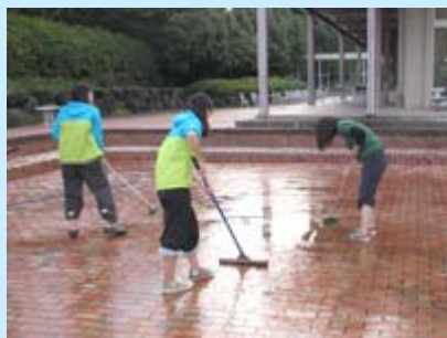
掃除作業中の若鮎祭実行委員会の 学生たち

来る10月27日、28日開催の若鮎祭に向けて、若鮎祭実行委員会の学生たちが、メイン会場となる中庭の池掃除を実施しました。