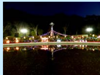
正面玄関前のイルミネーション

滋賀医科大学医学部附属病院 (正面玄関噴水前、玄関ホール、 外来棟2階ウッドデッキ)