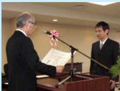
学位授与式の様子

平成24年度第1回滋賀医科大学学位授与式が10月1日(月)に本学管理棟大会議室で挙行され、課程博士5名、論文博士3名、修士1名にそれぞれ学位記が授与されました。