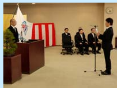
入学生宣誓の様子

志」を持ち続け、初心を忘れることなく、信頼される医療人として成長され、地域にあるいは世界にその成果を還元してくれることを祈念しています。」と、大学院入学生に対しては「温故知新」を忘れずに、自分の研究分野の文献を詳しく調べ、得られた実験データについて、指導者や同僚との議論を得て、さらに自分の工夫を加え、新しい知見をつけ加え、少しでも医療の道に生かせる努力をして下さい。」とそれぞれ激励しました。