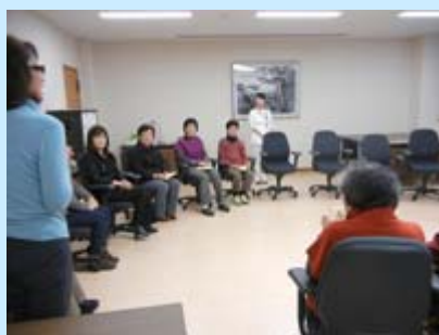
体験を語り合い、共有する機会となりました

看護師による「リンパ浮腫外来」を開設し6年目を迎えました。この外来では、主に乳がんや子宮がんなどの治療(手術や放射線治療)によって起こる、リンパ液の輸送障害を原因とする手足のむくみ(リンパ浮腫)を持つ患者様を対象に診療を行っています。