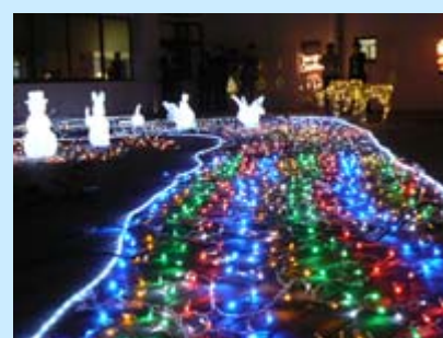
“瀬田の森”をイメージした 動物たちのイルミネーション