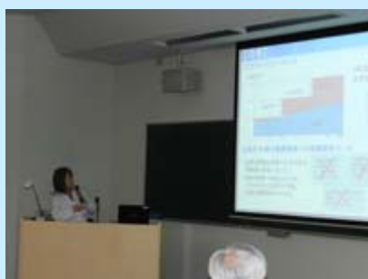
発表者による説明