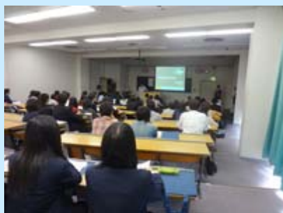
保護者を含めて76名の方がご参加