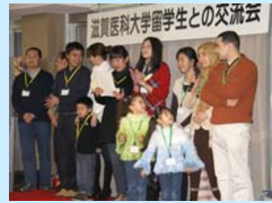
留学生等の自己紹介

最後には、参加者全員が学生管弦楽団の伴奏で、「富士山」と「琵琶湖周航の歌」を合唱し、和やかな雰囲気の中、お開きとなりました。