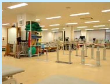
リハビリテーションAエリア (リハビリテーション部)