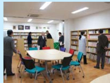
新しくなった院内図書室