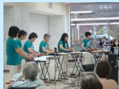
大正琴琴城流琴昇会の皆さん