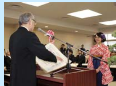
学位記の授与が行われました