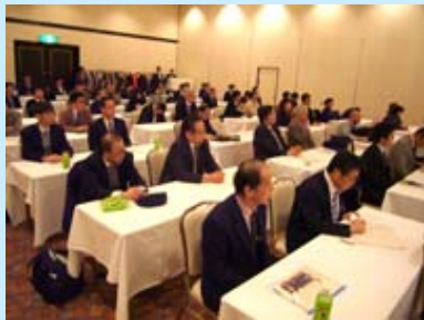
全体討議中の様子

1月27日(金)～28日(土)に「大学を支える人材を育むための宿泊研修」を長浜ロイヤルホテルにて開催しました。役員および教職員計78名の参加があり、講演・グループディスカッション・全体討議などを行いました。3回目となります本研修は、前回よりも参加対象をより拡大し、本学の課題について、若い世代も交えて考え、教職員一丸となって積極的に課題に挑戦する機会作りに努めることが出来ました。