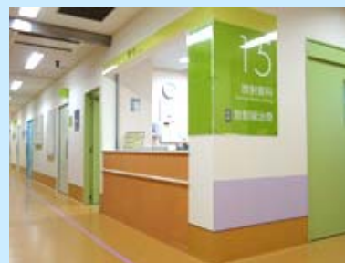
放射線科受付付近

平成21年12月より順次改修を行っておりました病院外来・中央診療部門改修工事のうち、外来診療科に関する改修工事が全て終了し、最後となるリハビリテーション科および放射線科の移転を終えました。