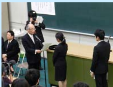
学生代表へ認定証書が 手渡されました