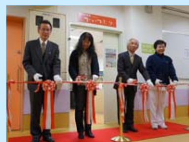
セレモニーの様子