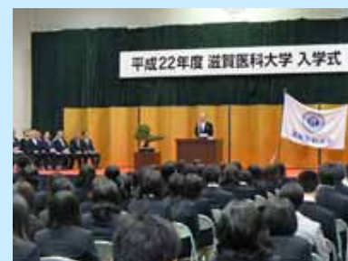
215 名の新入生を迎えました

また、入学生代表より、「勉学に励むことはもちろん、同じ医療従事者を志す仲間と切磋琢磨し、医療現場で必要とされる実践力や判断力を身につけていながら、自分の夢に向かって頑張っていきたいです。」と力強い宣誓が行われました。