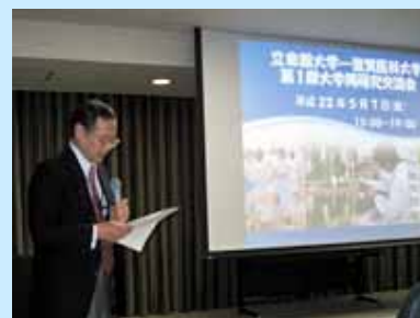
谷 学長補佐による 趣旨説明

今後、研究交流会をさらに推進するために、定期的に分野、テーマを選んで開催する予定です。