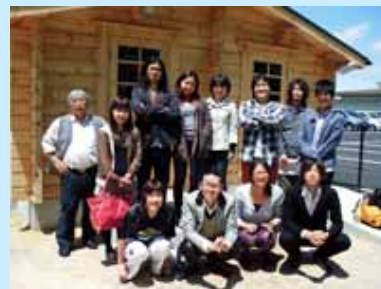
園芸部のみなさん

で、部員もまだまだ少ないのですが、日々奮闘しており、今回、ログハウス敷地の一部を綺麗に耕し、夏野菜のトマト・キュウリ・ナスなどを植えました。今後は、畑を広げたり、花壇を作ったりする予定とのことです。