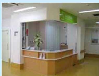
改修された歯科口腔外科

外来棟1階 歯科口腔外科の改修工事が完了し、5月29日(土)には、2階仮設診療ブースから元の場所への移転を行いました。また、リハビリテーション部(科)、治験管理センター(ゲノム面談室)の改修工事も完了し、5月30日(日)に、それぞれ生まれ変わった真新しいスペースに移転しました。