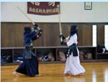
大学対抗で各クラブが熱戦を展開しました

5月14日(金)・15日(土)の2日間、浜松医科大学にて第35回浜松医科大学との交流会が開催されました。本交流会は、学生・大学間の交流を深めることを目的に、例年相互の大学を会場に実施しています。