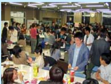
たくさんの参加者で会場は いっぱいになりました

4月20日(火)に本学福利棟食堂において、平成22年度の医学科、看護学科の新入生を迎え、新入生歓迎実行委員会主催の新入生歓迎レセプションが行われました。