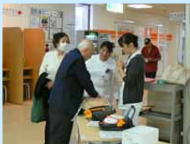
AED 使用方法説明の様子

5月12日は、近代的看護を確立したナイチンゲールの誕生日にちなんで「看護の日」です。本学附属病院でも、これにあわせ、看護の日イベントを開催しました。