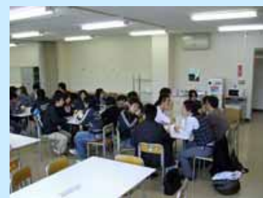
ラウンジで談笑する学生

ラウンジの設置目的は、「昼食時の食堂の混雑緩和」「学生のフリースペース」が主な目的ですが、多目的に利用できるスペースとなっており、給茶器・電子レンジ・湯沸かしケトルを設置したほか、清涼飲料の自販機も近日設置されます。