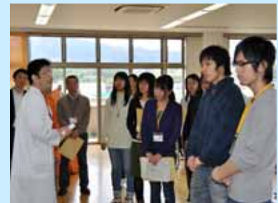
甲西リハビリ病院にて

なお、甲西リハビリ病院では NHK・中日新聞・びわこ放送の、公立甲賀病院では NHK の同行取材がありました。