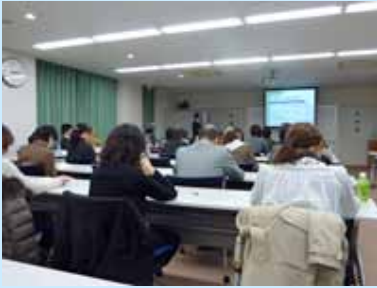
シンポジウムの様子

平成 22 年 3 月 6 日(土)滋賀県看護協会にて、滋賀医科大学医学部附属病院肝疾患相談支援センター、大津赤十字病院、滋賀県、滋賀県看護協会の共催で「平成 21 年度 滋賀県肝炎医療従事者研修会」を開催しました。