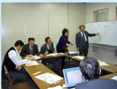
グループディスカッションの様子

1月8日(金)～9日(土)に「大学を支える人材を育む宿泊研修」を琵琶湖リゾートホテルにて開催しました。研修には、役員及び教職員計55名の参加があり、それぞれの役割を共有するとともに、教職員一丸となって積極的に課題に挑戦する土壌を創り出せるよう、講演・グループディスカッション・全体討論等を行いました。