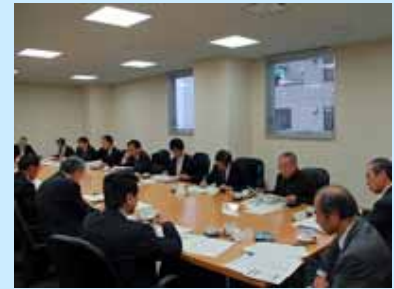
各機関から約20名が参加

らは、経営等担当理事・研究協力課長等)が出席し、拠点概要、拠点推進本部設置要綱の制定、専門推進部会の構成機関および活動内容等について検討が行われ、全国7地域程度に1~2億円を3年間支援する文部科学省の事業「地域イノベーションクラスタープログラム」に、当拠点として応募することとなりました。