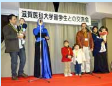
母国の歌や料理を披露

平成22年1月27日(水)に「国際交流の夕べ」と題して、滋賀医科大学に在籍する外国人留学生らとの交流会を開催しました。