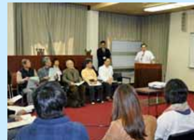
公立甲賀病院での意見交換会