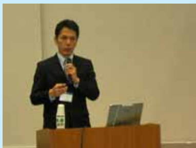
臨床検査医学講座 茶野准教授

JSTイノベーションサテライト滋賀主催の「第2回イノベーションフォーラムin滋賀」が、3月9日(火)大津市のコラボしが21にて開催されました。