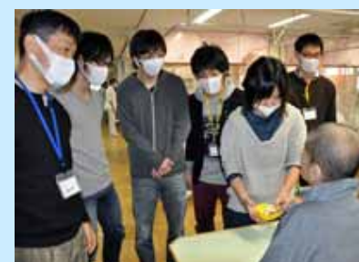
紫香染病院では食事介助もさせていただきました