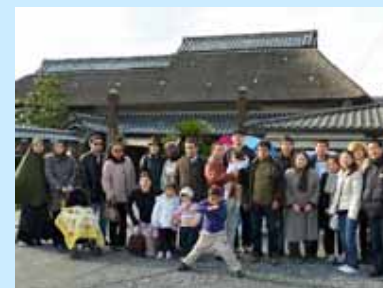
忍術屋敷も見学しました

忍術屋敷では、いろいろなからくりの説明をうけ、子供が大はしゃぎでかまわっていました。