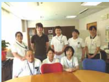
看護部のみなさんと記念撮影

ミシガン州立大学連合日本センターとの交流協定により、ミシガン州立大学の学生を実地研修学生として受け入れました。