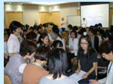
のべ148名の参加がありました

毎年恒例の本研修会は、助産に関する知識と技術の向上と、滋賀県近隣で勤務をしている助産師達の交流の場となっております。