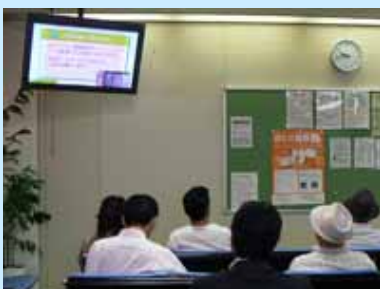
各種お知らせ、案内、漢字クイズなどを放映しています

病院広報の強化・患者サービスの向上を目指し、附属病院各科外来の待合等に設置しているディスプレイの内容を全般的に見直し、「滋賀医大チャンネル」としてリニューアルしました。