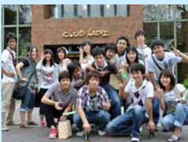
施設見学や散策しました

2日目には、病院再編が議論されている東近江市立の能登川病院と蒲生病院の外観を見学、ヴォーリス記念病院と国立病院機構滋賀病院では、日頃の医療活動についてのお話を拝聴した後、施設見学をさせていただくなど、2日間を通してたいへん有意義な研修となりました。