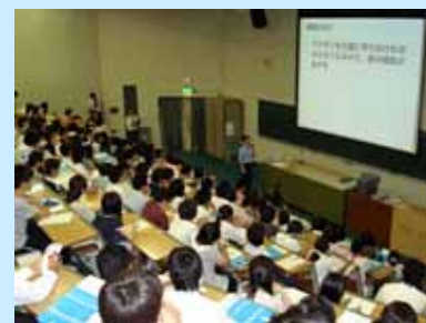
会場いっぱいの参加者

当日は、県内外から高校生、保護者等合わせて約370名の参加がありました。参加者には入試情報やカリキュラムの説明に引き続き、「インフルエンザの迷信」「眼の不思議」と題した模擬講義により、実際の大学教授一昨年から実施している学内施設見学は今年から定員を大幅に増やし、100名を超える方に参加していただき、大好評でした。また、個別相談コーナーにも多くの方に参加いただきました。