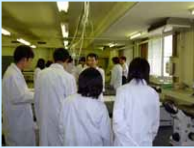
医学コースでの実習

8月18日(火)・19日(水)の2日間にわたり、滋賀医科大学・滋賀県立虎姫高等学校連携講座を開催しました。当日は、虎姫高校2・3年生24名が本学で講義等を受講しました。