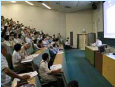
熱心に講演に聞き入る参加者