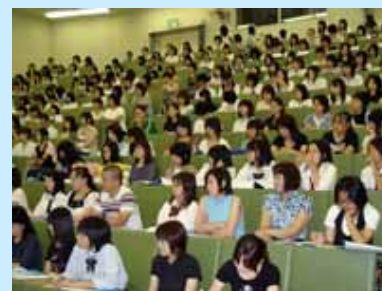
過去最多の参加者