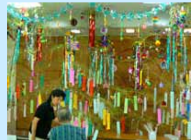
多くの方が飾り付けに足を止めておられました

期間中は来院いただいた方に願い事を書いていただけるよう、短冊を用意、短冊はまとめて神社に奉納しました。