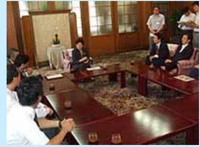
授与式での記念撮影

本プロジェクトは、県内の企業63社のネットワーク組織、本学、立命館大学、県で構成し、今後10年間にわたり、医療機器の小型化や、高機能化、産業創出などを進めていくものです。