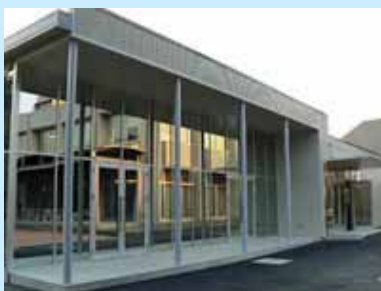
学生文化系課外活動団体の活動拠点

平成 21 年 4 月 6 日(月)、クリエイティブモチベーションセンターを新設し開所式を行いました。クリエイティブモチベーションセンターは、主に、学生文化系課外活動団体が、より充実した活動を行えるための総合的な活動拠点を構築することを目的に建てられたものです。