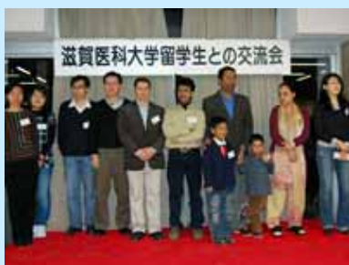
外国人留学生等と親睦を深めました

平成21年1月7日(水)に、「国際交流の夕べ」と題して、滋賀医科大学に在籍する外国人留学生らとの交流会を開催しました。