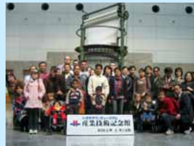
トヨタテクノミュージアム産業技術記念館にて

名古屋城では、尾張名古屋のシンボルといわれる金鯱をみて大きさに驚き、また満開の梅林からみる雄大なそして美しい天守閣の姿に感動しました。本丸御殿障壁画や表二之門等の重要文化財、復元された天守閣、金鯱など、日本の歴史にふれることができ、また外国人留学生、外国人研究者との間の交流も深まり、有意義な1日を過ごすことができました。