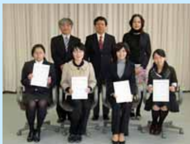
修了者との記念撮影

平成19年度採択の文部科学省社会人の学び直しニーズ対応教育推進事業における臨床心理士研修コースの修了式を実施しました。