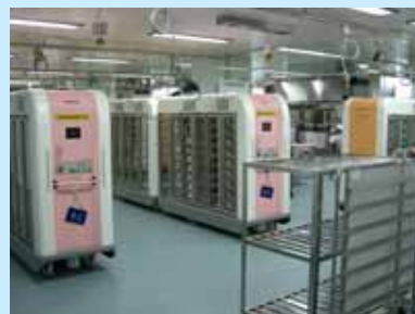
衛生管理の徹底等に配慮された新厨房