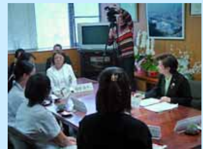
女性医師確保対策等をテーマに対話を行いました

また、当日は、びわ湖放送の取材班も訪れており、対話の様子は、2月21日(土)18:10～18:45の「県政週刊プラスワン」で紹介されました。