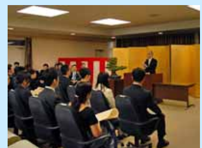
(上) 医学部 卒業式 (下) 大学院 学位授与式