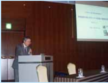
来見准教授による成果報告

本学では、平成19年度から3年間の計画で滋賀県において採択された「文部科学省都市エリア産学官連携促進事業(発展型)-びわこ南部エリア-」を実施しています。