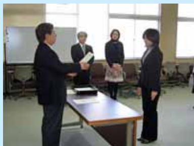
服部理事より修了証書を授与