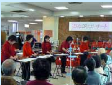
大正琴琴城流琴昇会による演奏

3月2日午後3時20分から、附属病院の玄関ロビーにて、例年ご協力くださる大正琴琴城流琴昇会による「ひなまつりコンサート」が行われ、入院患者さんをはじめ多くの方々が、大正琴の優雅な音色に耳を傾けました。