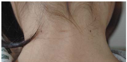
図 2 破線状の表皮剥脱と蒼白帯