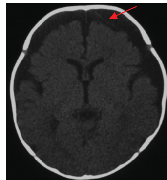
図 4 初診時の CT