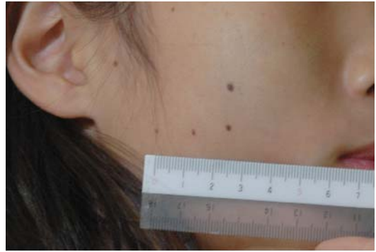
図 1 腫脹し，淡青色調を示す右頬