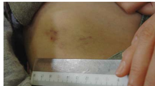
図 3 腸骨翼の皮下出血