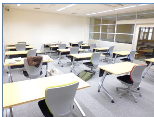
視聴覚資料閲覧室と複写室を閲覧室に改修し、座席を増やしました。