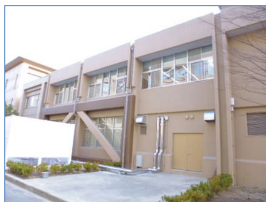
耐震改修で外側に鉄骨が入りました