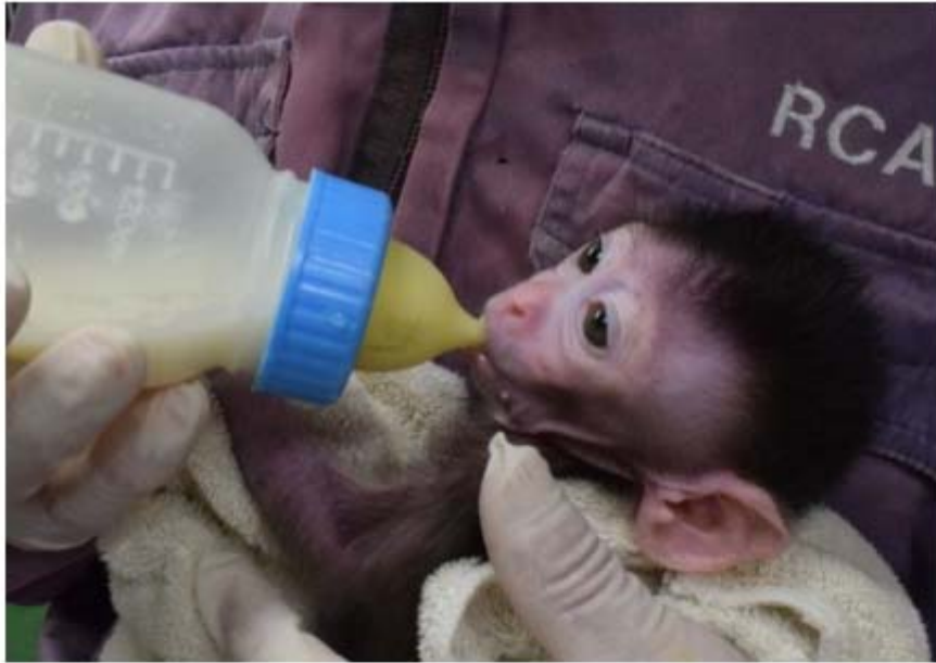
図1. 本研究で作出したADPKDモデルカニクイザル