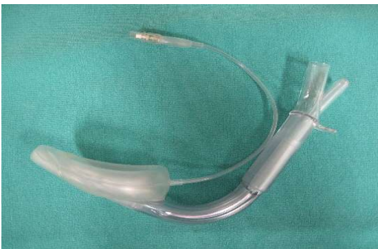
図 5 LMA Supreme

挿入手技に関しては盲目的に挿入するだけであり短時間のトレーニングで十分とするものから [31] 750例の経験で合併症なくスムーズに挿入できるとされる報告まで様々であるが [32] 、およそ40例程度の経験は必要と考えられる [33] 。器具の形状は挿入しやすいように改良を遂げてきた。現在汎用されているラリンジアルマスクはLMA Supreme(図5)と呼ばれ挿入しやすい形状のシャフトとマスクの屈曲を防ぐ構造となっている [34] 。挿入時間や成功率が以前のラリンジアルマスクと比較し有用との報告もあるが [35,36] 引き続き検討が必要と考えられる [37,38] 。