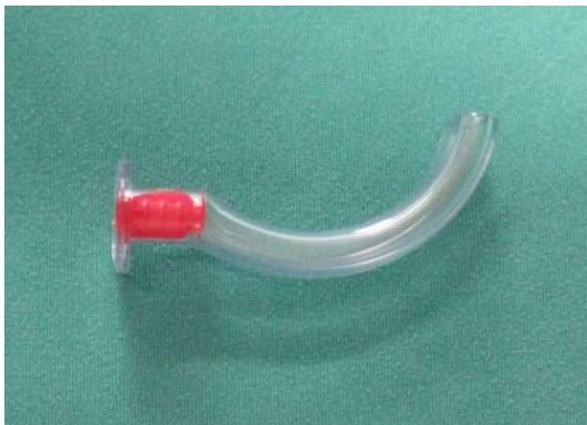
図1 口咽頭エアウェイ

マスク換気は最も基本的な気道確保法である。そのため容易で安全な手技と考えられるが一概にそうとも言えない。覚醒時には神経系調節により咽頭拡大筋群の筋緊張が保たれているが意識レベル低下によりこの調節機構が抑制され [12] 、舌根、軟口蓋、喉頭蓋が重力により背側に移動し上気道閉塞が起こる [13] 。これらの閉塞を解除し換気を行うためには頭部後屈が必要となる。マスク換気中はこの頭部後屈を行うが、頸部に外力が加わるので外傷等で頸椎頸髄損傷が疑われる患者では注意が必要である [14] 。さらに食道、胃への送気による誤嚥や圧外傷の報告もある [15] 。心肺停止患者では食道括約筋の緊張が低下するため胃に空気が入りやすい [16] 。このようにマスク換気も決して安全な手技とも言い難く、さらに実際行ってみると簡単な手技でもない。頭部後屈・下顎前方移動・開口の3つは triple airway maneuver と呼ばれ、頸椎に問題がなければマスク換気をより確実にする手技である [17] がトレーニングをしないとまず一人では施行できない。マスク換気を確実に施行するには一人で行うよりも二人で行う両手法が確実であることが示されているので、不慣れた医療者は必ず二人で行うべきである [18,19] 。換気が難しい場合、口咽頭エアウェイ（図1）もしくは鼻咽頭エアウェイ（図2）を用いると容易になることがある。口咽頭エアウェイ（経口エアウェイ）はJ型の形状をしており舌に沿って挿入することで舌と舌根を咽頭後壁から分離する。咳反射や咽頭反射がある場合には嘔吐