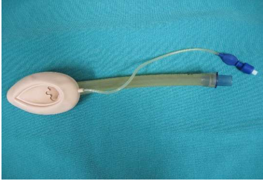
図 4 ラリンジアルマスク

が思った以上に難しいこと、喉頭蓋が押し込まれる、マスク先端が屈曲するなどの理由で換気ができないケースがあること、気管内を完全にブロックできないため気管挿管と比べ誤嚥のリスクが否定できないこと、胸骨圧迫によって位置がずれることなどを危惧しているものと考えられる [30] 。