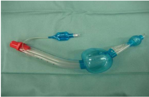
図 8 ラリンジアルチューブ

きない困難気道の際に有用な器具となることである。日本をはじめ、米国、英国など各国の困難気道の際の管理ガイドラインに声門上器具の使用が推奨されている [56, 57, 58] 。