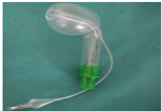
図3 Tulip Airway

一般的に総義歯の患者で義歯をはめていない状況でのマスク換気はマスクの密着が不十分となるため非常に難しい [22,23] 。口腔内にガーゼを詰めてマスクの密着を改善させるなどの工夫が必要となる [24] 。Tulip Airway（図3）は一般的な経口エアウェイと形状が類似しているが、付属の低圧大容量カフによって中咽頭のシールができ、15mm コネクタにより陽圧換気が可能となるエアウェイである [25] 。我々はマスク換気が難しい患者、特に総義歯患者のようにマスクフィットの問題のある患者では、この Tulip Airway が有用ではないかと考え現在検討を続けている [26] 。