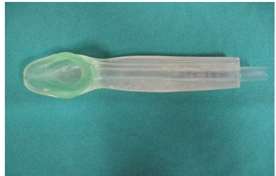
図 6 i-gel

さらにカフがなく挿入するだけで換気可能な声門上器具 i-gel(図6)も臨床利用されている。マスクにカフがないため先端の屈曲が起らず、カフ空気を注入する必要もないため数秒で気道が確保できるとも言われている [39] 。マスクはゲル素材で作られており喉頭周囲を覆うことでリークを防いでいる [40] 。簡便で素早く気道確保ができるため救急領域において広く用いられている [41,42,43] 。