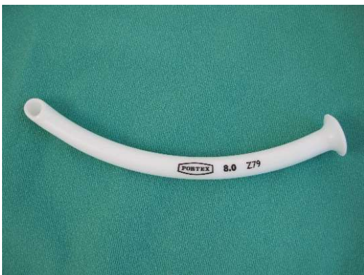
図2 鼻咽頭エアウェイ

や喉頭痙攣を誘発する可能性があり用いてはならない [20] 。鼻咽頭エアウェイ（経鼻エアウェイ）はやわらかいチューブ型の器具であり、鼻孔と咽頭との通路を確立する。口咽頭エアウェイと異なり、咳反射や咽頭反射に対する忍容性は高いが鼻出血には注意が必要である [21] 。