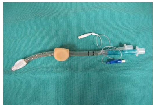
図 7 コンビチューブ

救急救命士の間では食道閉鎖式エアウェイであるコンビチューブ(図7)が広く臨床使用されてきた。盲目的に口腔からチューブを挿入すると食道に挿入されることを利用して、先端のカフで食道への送気をブロックしチューブ中央のカフで咽頭口腔への空気のリークを防いで気道への送気を可能にするチューブである。発想は非常にユニークだが残念ながらコンビチューブは素材が硬く、食道の外傷が懸念されてきた [47,48] 。そこで改良により小型化され比較的やわらかく作られているラリンジアルチューブ(図8)と呼ばれる声門上器具が現在用いられている。挿入は容易で [49,50,51] 米国での救急現場において最も汎用されている声門上器具であり [52] 、本邦でも救急救命士の気道確保において多く利用されている [53,54] 。ただし盲目的な食道への挿入のため合併症の報告もあり扱いには注意を要する [55] 。