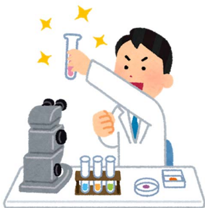
滋賀医科大学の研究者