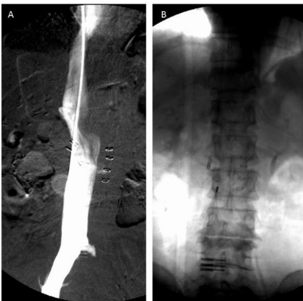
図 2. IVCF 留置時の下大静脈造影

に微小な塞栓を認めた (図 1)。D ダイマーは 83.2ng/ml と上昇していた。肺血栓塞栓症 (pulmonary thromboembolism : PTE) を伴う DVT と診断し，ヘパリ