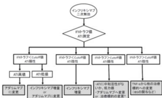
図 2 . インフリキシマブ投与のアルゴリズム

患者では ADA への変更も有効かもしれないが、 確実なのは IFX の増量であろう。さらに、 基本的な考え方として、一端 IFX を投与して ATI 陽性となると AAA が容易に誘導されてしまう ので、バイオナーブ症例はまず ADA で治療を 開始して一次無効、効果減弱が認められるよ うなら IFX に変更するような戦略が 基本のように思われる。