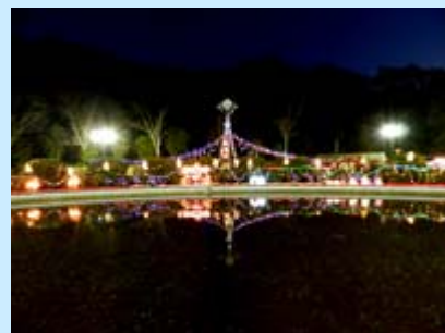
正面玄関前のイルミネーション

滋賀医科大学医学部附属病院 (正面玄関噴水前、玄関ホール、 外来棟2階ウッドデッキ)