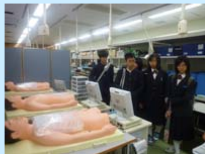
スキルズラボ見学の様子