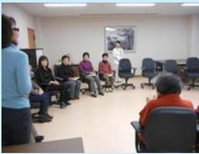
体験を語り合い、共有する機会となりました

看護師による「リンパ浮腫外来」を開設し6年目を迎えました。この外来では、主に乳がんや子宮がんなどの治療(手術や放射線治療)によって起こる、リンパ液の輸送障害を原因とする手足のむくみ(リンパ浮腫)を持つ患者様を対象に診療を行っています。