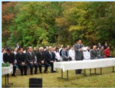
センター長慰霊のことは

その後、出席者全員による献花が行われ、過去一年間(平成23年10月～平成24年9月)に実験に供された動物の御霊の冥福を祈りました。