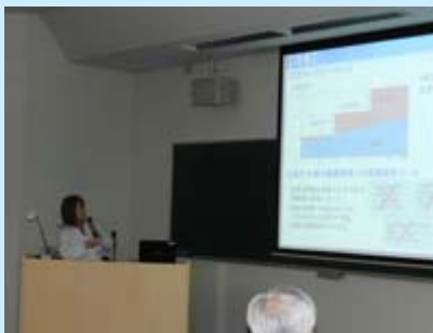
発表者による説明

学内各部署の相互理解と更なる業務の改善と効率化を図ることを目的に、9月21日(金)から10月1日(月)までの期間、各職場における業務改善の取組や提案について発表する「業務改善等発表会」を開催しました。