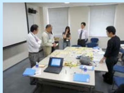
KJ法を使っでのグループワーク