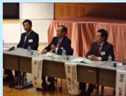
パネルディスカッションの様子