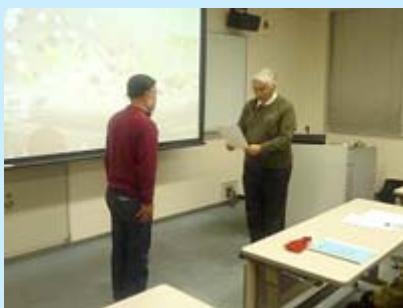
代表の方に修了証書をお渡ししている様子

11月2日(金)、8日(木)、16日(金)の3日間、ピアザ淡海において第29回目となる滋賀医科大学公開講座を実施しました。