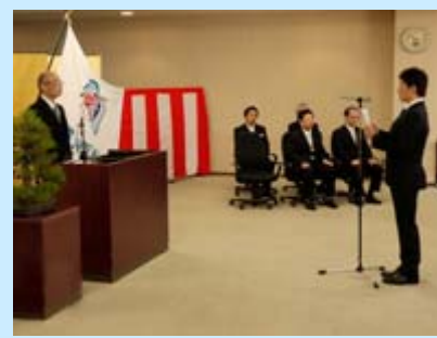
入学生宣誓の様子

志」を持ち続け、初心を忘れることなく、信頼される医療人として成長され、地域にあるいは世界にその成果を還元してくれることを祈念しています。」と、大学院入学生に対しては「温故知新」を忘れずに、自分の研究分野の文献を詳しく調べ、得られた実験データについて、指導者や同僚との議論を得て、さらに自分の工夫を加え、新しい知見をつけ加え、少しでも医療の道に生かせる努力をして下さい。」とそれぞれ激励しました。