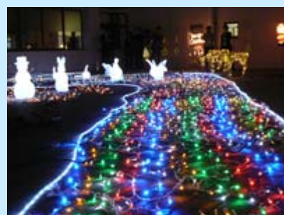
“瀬田の森”をイメージした 動物たちのイルミネーション