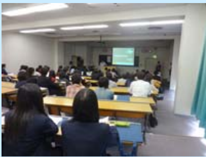
保護者を含めて76名の方がご参加