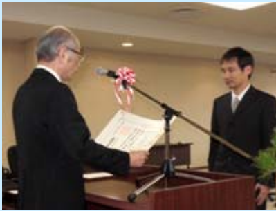
学位授与式の様子

平成24年度第1回滋賀医科大学学位授与式が10月1日(月)に本学管理棟大会議室で挙行され、課程博士5名、論文博士3名、修士1名にそれぞれ学位記が授与されました。