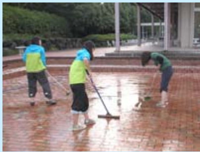
掃除作業中の若鮎祭実行委員会の学生たち

来る10月27日、28日開催の若鮎祭に向けて、若鮎祭実行委員会の学生たちが、メイン会場となる中庭の池掃除を実施しました。