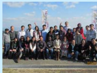
あわじ花さじきで記念撮影