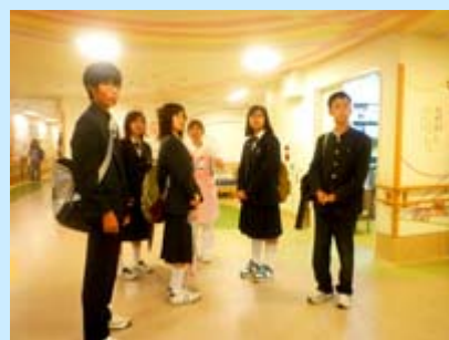
5 A 病棟見学の様子

同校では、各班ごとに近隣の大学を訪問し、将来の進路選択の参考にしているようですが、初めて体験した大学と病院の様子に目を丸くして見学し、医学部に対する興味を深くしたようでした。