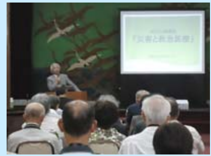
柏木病院長の挨拶