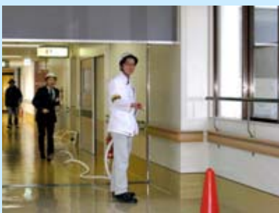
屋内消火栓操作訓練