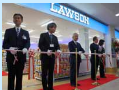
オープンセレモニーの様子

12月12日(月)附属病院1階にコンビニエンスストア:ホスピタルローソンがオープンしました。