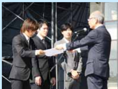
受賞のハンドボール部3人