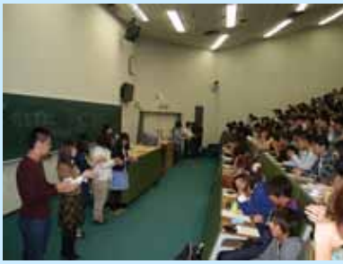
衛生担当の学生の主導による 手洗い講習

本学では、例年、若鮎祭実行委員会の主催で、模擬店の調理担当者を対象に衛生講習会を実施しています。受講は対象となる者すべてに義務づけており、この講習を受けなければ調理を担当することができません。