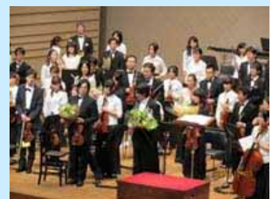
大盛況な演奏会となりました