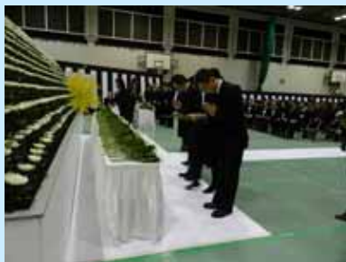
出席者全員による献花が行われました

10月27日(木)午前10時から本学体育館において、ご遺族、ご来賓、しゃくなげ会会員及び教職員・学生約600名の参列の中、厳かに第37回滋賀医科大学解剖体慰霊式を執り行いました。このたびは系統解剖36霊、病理解剖35霊、法医解剖82霊、計153霊を新たにお祀りし御霊のご冥福をお祈りしました。