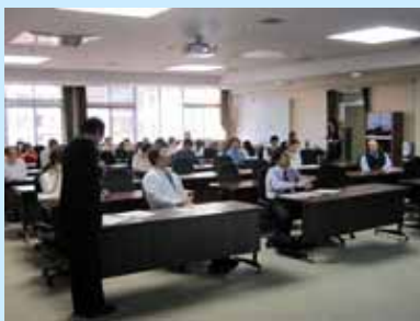
会場の全体の様子

10月13日(木)に、第27回滋賀医科大学公開講座が草津市立まちづくりセンター(3階会議室)を会場として始まりました。