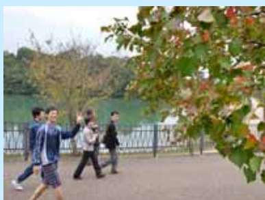
ウォーキングで心身の リフレッシュ

10月30日、滋賀医科大学 糖尿病協会月輪会で恒例の「あるこう会」が開催されました。