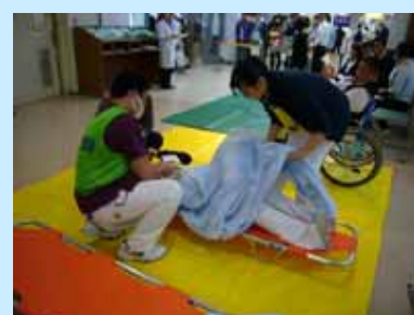
負傷者応急処置・トリアージ訓練