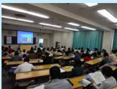
保護者を含めて 73名の方がご参加