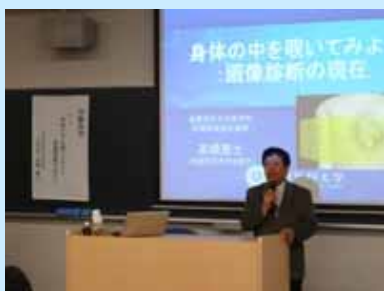
服部副学長の挨拶