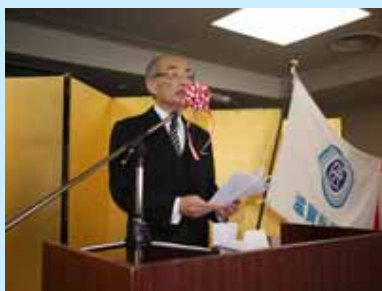
馬場学長による告辞