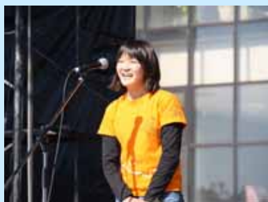
ヨット部代表の受賞スピーチ

10月29日(土)、第37回若鮎祭開会式終了後に中庭水上特設ステージで、滋賀医科大学学生表彰の表彰式を挙行了しました。