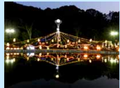
正面玄関のイルミネーション