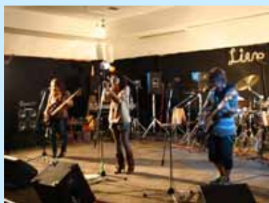
軽音バンドによる熱演