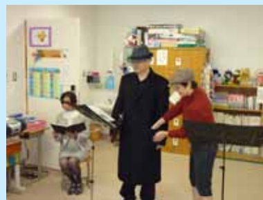
朗読演劇「歌時計」の様子