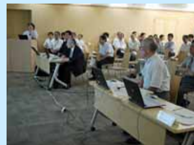
発表者による説明

・病院管理課 「文書ファイル整理術 ～ちょっとの工夫で3つの効果～」 ・看護部手術部 「手術患者入退室方法変更の取り組み」 ・総務課 「すぐに診察に入れます」のその後」