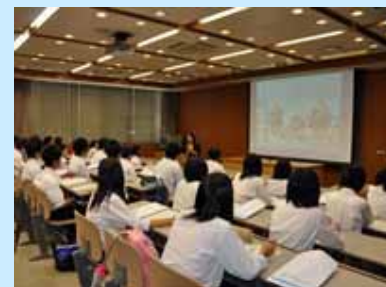
岡山准教授の講義

参加生徒はまだ1年生で、進路先を明確にしている生徒は少なかったようですが、大学の教育の一端や施設、学生生活の雰囲気を少しは感じ取った様子でした。