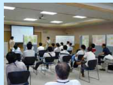
グループごとの全体発表