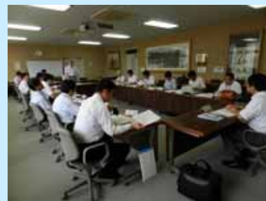
馬場学長からの挨拶

懇談会終了にあたり、学長から本学の良さを地域の方に伝えきれていないことから、今後も継続的にこのような場を設けられるよう希望している旨の説明がありました。