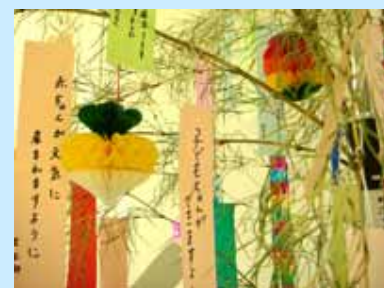
たくさんの願いが込められています