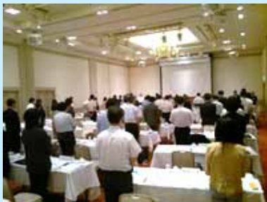
東日本大震災被災者へ黙祷を捧げる参加者