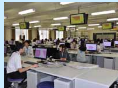
バーチャルスライド観察の様子

また、昼の休憩前には附属図書館の見学が、講座終了後には中庭で記念撮影が、それぞれ行われました。