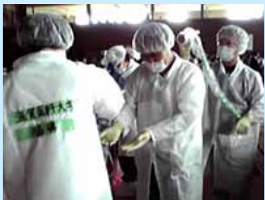
川内村体育館内の様子