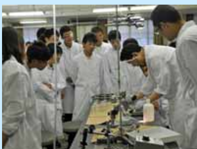
生理学実習の様子

9月20日(火)に膳所高校の理数科1年の生徒39名が講義と実習のため本学に来ました。同校の2年生は基礎医学講座受講のため4月から何度か来学していますが、1年生は初めてです。