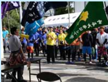
服部副学長による開会式の挨拶