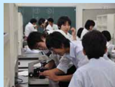
生化学実験実習の様子

参加生徒たちは、講義とは違った場所と雰囲気戸惑いながらも、熱心に指導を受けていました。