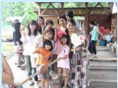
バームクーヘン作りました

去年に引き続き、今年も小児科サマーキャンプを行いました。期間は8月26日(金)から一泊二日、場所も去年と同様、グリム冒険の森(滋賀県蒲生郡日野町)で行いました。参加者は25家族、60人、医療者スタッフ、学生ボランティアを含めると100人以上の大規模なキャンプとなりました。