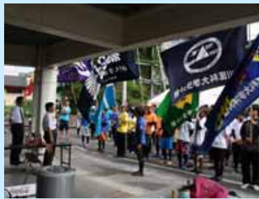
代表校による選手宣誓