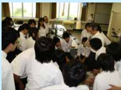
臓器の標本に見入る高校生