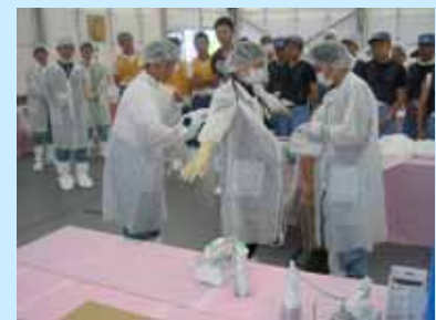
スクリーニング打合せ (リハーサル)