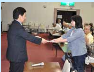
受講者代表の方に 修了証書の授与

『大丈夫？あなたの肺と心臓は、』をメインテーマに、第26回滋賀医科大学公開講座を、草津市立まちづくりセンター(3階会議室)を会場として開催しました。