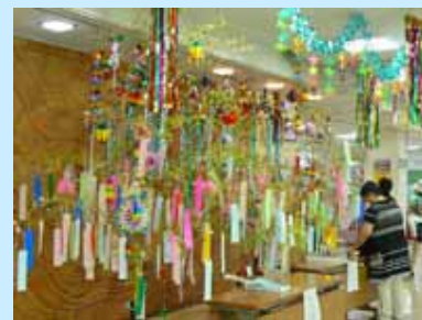
色鮮やかな七夕飾り

期間中は来院いただいた方に願い事を書いていただけるよう、短冊を用意しました。短冊はまとめて神社に奉納しました。