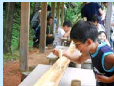
子供たちのいきいきとした笑顔見ることができました

これから入院される方や、現在も闘病を頑張っておられる子供達、ご家族にとって励みとなり、希望となるようなキャンプとなるよう、来年以降も継続したいと考えております。