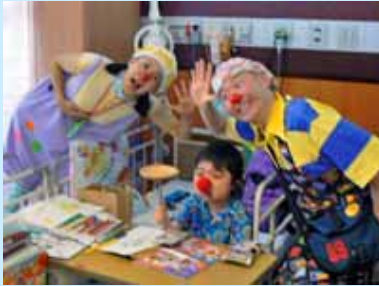
クリニクラウンが 各病室を訪問しました