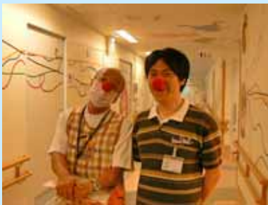
スタッフも赤い鼻

8月7日は「RED NOSE DAY(あかいはなの日)」です。世界中の人に笑顔を贈る日として、各地でイベントが開催されます。