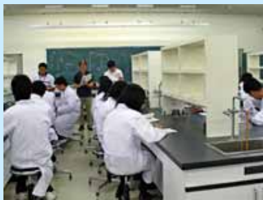
医学コースでの実験実習

8月17日(火)・8月18日(水)の2日間にわたり、滋賀医科大学・滋賀県立虎姫高等学校連携講座を開催し、虎姫高校の生徒35名が本学で講義等を受講しました。