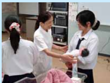
助産師体験の様子

8月4日(水)に看護学科オープンキャンパスを開催しました。当日は、県内外から高校生、保護者等合わせて過去最多となる307名の方にご参加いただきました。