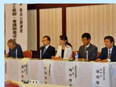
シンポジストの先生方

行政、医療関係、里親・プチ里親、各種団体の方など、約60名のご参加をいただき、大変有意義な公開講座となりました。お忙しい中ご参加いただきました皆さま、ありがとうございました。