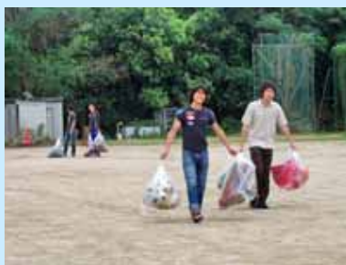
グラウンドのゴミ収集

7月2日(金)の放課後にすべての体育系課外活動団体(22団体)が参加し、体育館、武道場、グラウンド等の活動場所の一斉清掃を実施しました。