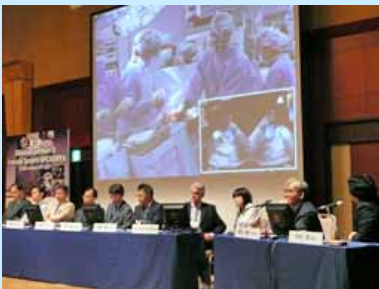
手術の映像が研究会会場に 生中継されました

平成 22 年 7 月 28 日、「第 1 回日本 Advanced Heart & Vascular Surgery/OPCAB 研究会」(滋賀医科大学心臓血管外科主催)において、本学附属病院新手術棟にて 2 例の心臓外科手術の映像を生中継(ライブデモンストレーション)いたしました。手術室には、国内およびアメリカ、イタリアからゲストの心臓外科医、循環器内科医をお招きし最新の手術に対してコメントをいただきました。