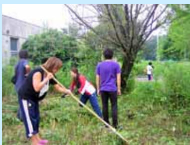
プール前の草刈り