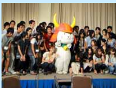
ひこにゃんと記念撮影

文部科学省に学生支援GPとして選定された『地域「里親」による医学生支援プログラム』の事業として、「彦根・米原・伊吹山方面の医療と歴史・文化を学ぶ」と題し、8月26日(木)～27日(金)の2日間、宿泊研修を実施しました。大変な猛暑の中でしたが、学生・教職員合せて、過去最高の55名での研修となりました。