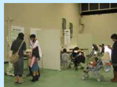
(上) 会場内の様子 (下) 健康チェックコーナー