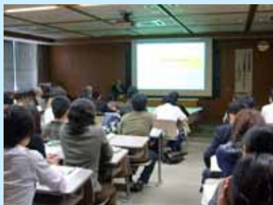
熱心に耳を傾ける受講生

平成20年度文部科学省「戦略的大学連携事業」に、滋賀医科大学と長浜バイオ大学の共同事業「びわこバイオ医療大学間連携戦略」が選定されました。