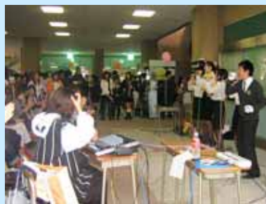
(左) 講演会場の様子 (右) アカベラグループのステージ