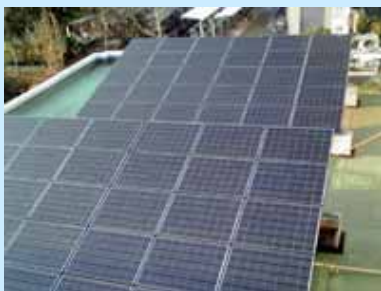
太陽光発電パネル

この度、基礎実習棟の屋上に、最大7.5Kwの太陽光発電システムを増設しました。昨年度設置した最大2.5Kwの太陽光発電システムとあわせて、合計10Kwの設備が完成、稼働を開始しました。