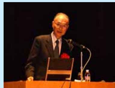
上島教授 受賞講演の様子

11月1日(土)には、「第61回日本医師会設立記念医学大会」において、表彰式及び受賞講演が執り行われました。