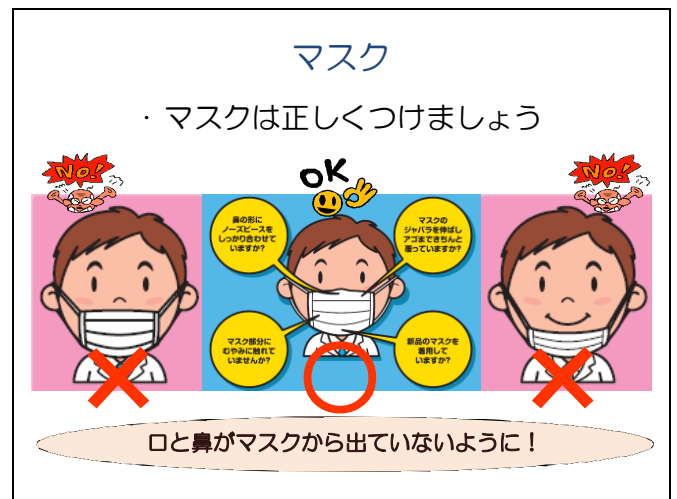
図 2. 正しいマスクの着用方法

スタッフに関しては、2 月 26 日から感染対策チームによるサージカルマスクの着用方法および手洗いの指導と実施の徹底を行った。サージカルマスクの着用方法については、視覚的にわかりやすくするためスタッフの控え室やスタッフステーション内にポスター掲示 (図 2) も行った。インフルエンザを発症したスタッフは、解熱後 2 日間の就業制限を行い、患者については個室隔離、場合によってはコホート隔離および飛沫予防策を行った。