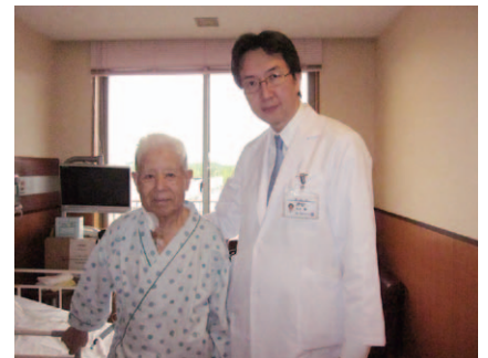
弓部大動脈全置換術の翌日に病棟で歩行している85歳の患者様。最高難易度の手術でも超早期回復でお応えします。

また、より低侵襲な手術としてステントグラフト挿入術があります。これは通常の手術のように開腹や開胸をせずに、カテーテルで内側から瘤をなおす治療です。当院でも2009年からステントグラフト治療を開始し、症例を積み重ね、胸部でも腹部でも、最重症例に自信を持って対応できるようになっています。